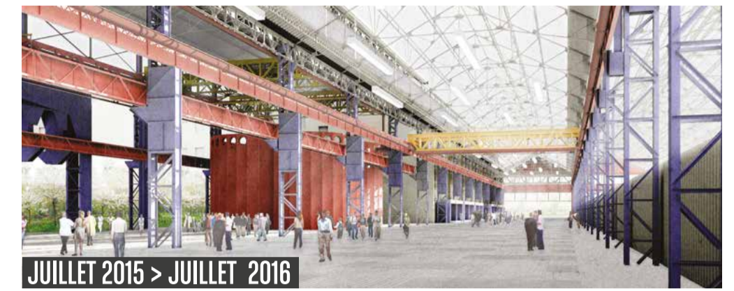
JUILLET 2015 > JUILLET 2016

Afin de récolter les eaux pluviales tombant sur les toitures des halles et notamment du lycée, une cuve de 9 mètres de haut va être installée à côté du passage couvert, dans la halle F8 réhabilitée.