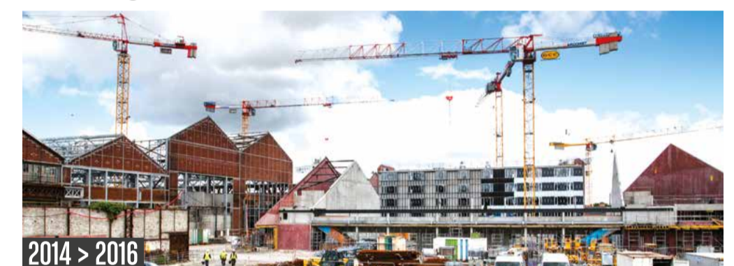
2014 > 2016

Les travaux du lycée hôtelier ont démarré en juin 2014. Il a d'abord fallu déconstruire et réhabiliter les halles dans son emprise.