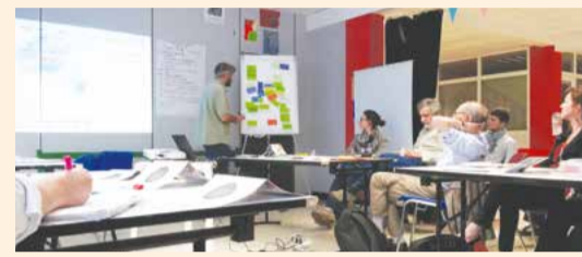
PROJET DE TIERS-LIEU 1 er comité de pilotage avec tous les partenaires - 28 mai 2015