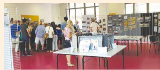
JOURNÉES DU PATRIMOINE 2014