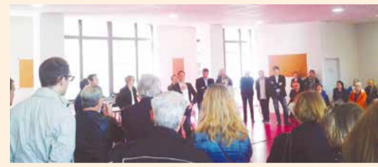
RÉUNION INFO CHANTIER 30 mai 2015