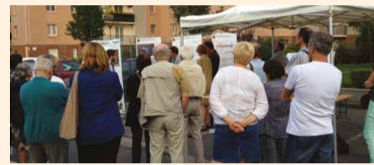
ATELIER RIVERAIN "VOIE NOUVELLE" 18 septembre 2014