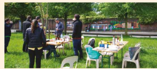
FÊTE DE L'EUROPE 9 mai 2015