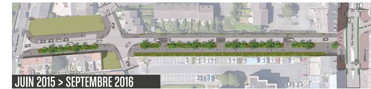
JUIN 2015 > SEPTEMBRE 2016

Afin de relier directement le site Fives Cail au métro Marbrerie, et ainsi privilégier les mobilités douces et l'intermodalité, une nouvelle voie en sens unique avec bande cyclable, connectant le parvis du lycée à la rue P. Legrand va être réalisée.