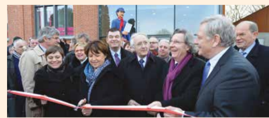
INAUGURATION DE LA BOURSE DU TRAVAIL 2012