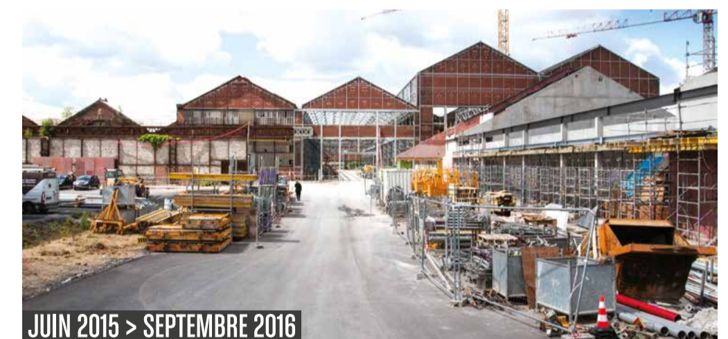
JUIN 2015 > SEPTEMBRE 2016

Le site Fives Cail, datant de 1861, nécessite des travaux réguliers afin d'être maintenu en bon état.