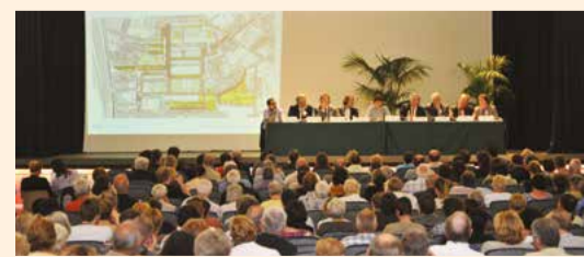
RÉUNION PUBLIQUE 2010