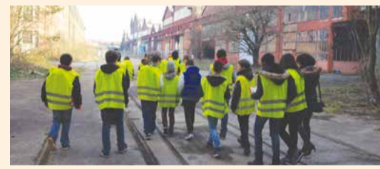
PARTENARIAT AVEC LE COLLÈGE BORIS VIAN depuis 2012